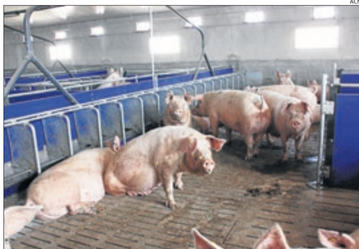
Imagen de una granja de producción de porcino en Ivars d'Urgell.

La rebaja de los precios se produce en un momento en el que la pandemia del coronavirus y todas las medidas de confinamiento y controles extremos de medidas sanitarias y de seguridad han reducido la productividad de los mataderos. El secretario general de la patronal de industrias cárnicas Fecic, Josep Collado, explicó que las empresas han incrementado los estándares de seguridad estableciendo separaciones de al menos metro y medio entre sus trabajadores, una situación que se deja sentir en las líneas de trabajo.