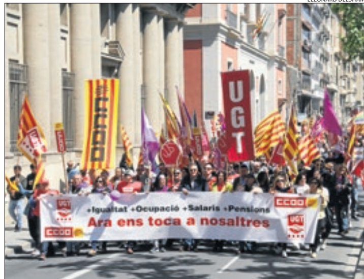
Los sindicatos exigieron empleo de calidad el pasado 1 de mayo.

Igualmente, Lleida es la provincia catalana en la que hay mayor tasa de temporalidad en los nuevos contratos. Así, se firmaron hasta el 30 de octubre un total de 144.888 contratos temporales, lo que supone el 89,69% del total de los contratos. El resto, 16.650 fueron indefinidos, el 10,31%. Concretamente, el mes pasado se firmaron 12.906 temporales en las comarcas leridanas, frente a los 1.965 fijos. Entre los de duración determinada, los contratos más comunes fueron los