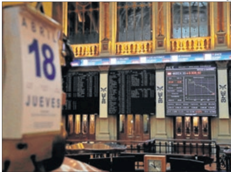
Imagen de la última jornada bursátil de esta semana.

Destaca los últimos datos macroeconómicos de China, donde el crecimiento del PIB, el impulso de las ventas y el aumento de